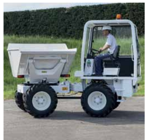
Las imágenes son de carácter ilustrativo, algunas de ellas pueden contener accesorios no incluidos en el precio.