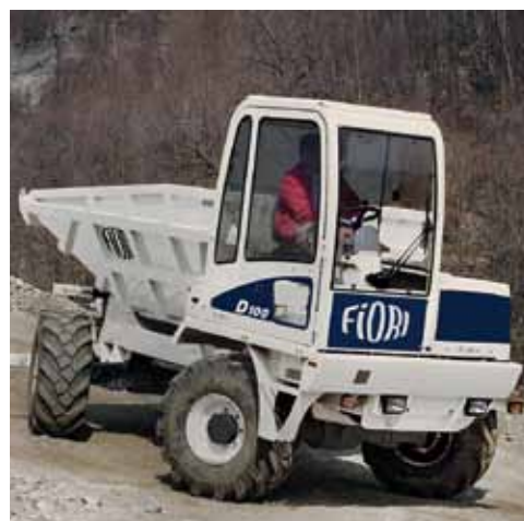
Las imágenes son de carácter ilustrativo, algunas de ellas pueden contener accesorios no incluidos en el precio.